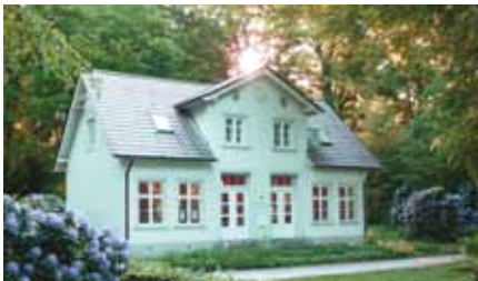
Sierichsches Forsthaus (Otto-Wels-Straße 3)

Sierichsches Forsthaus, Otto-Wels-Str. 3 | Eintritt frei (Wir freuen uns über Spenden)