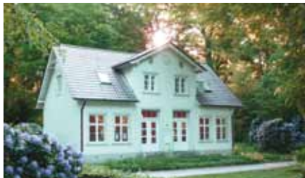
Sierichsches Forsthaus (Otto-Wels-Straße 3)

Sierichsches Forsthaus, Otto-Wels-Str. 3 | Eintritt frei (Wir freuen uns über Spenden)