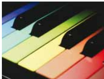
Das bunte Klavier