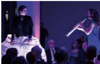
Is it real? | Foto: Urban Ruths