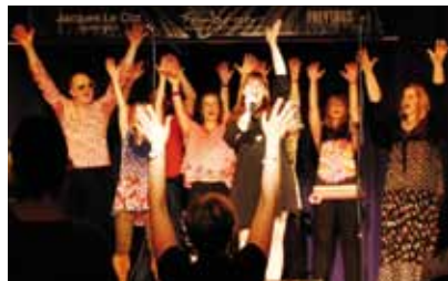
Your Music Session