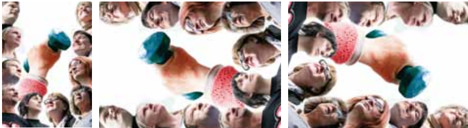
Ensemble theater 36

Bühne nach Hof | AK 12,- / 8,- | VVK 10,- / 6,- (zzgl. evtl. anfallender Vorverkaufsgebühren)