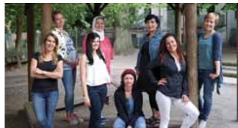
Fremd doch nah