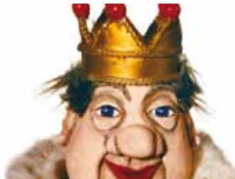
Der kleine König Dezember